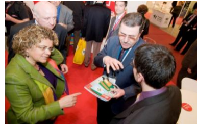
Març 2009. Es presenta la iniciativa a la Consellera de Sanitat de Catalunya, Marina Geli, en el Congrés Europeu d'Oficina de Farmàcia.

Es consolida la Jornada de recollida de Medicaments aconseguint una fita històrica, tant pel número de farmàcies i de voluntaris col·laboradors com pel número de persones beneficiades d'aquesta acció.