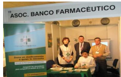
Febrer 2010. El Banc Farmacèutic està present en les 'XIII Jornadas profesionales y VI Internacionales de medicamentos para el auto cuidado de la salud y parafarmacia, "COFMANEFP"' a Madrid.