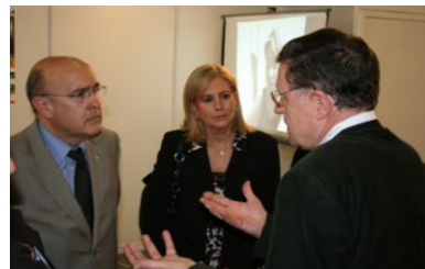
Març 2011 (INFARMA). Reunió del Banc Farmacèutic d'Itàlia, Portugal i Espanya amb els Col·legis de Farmacèutics de Madrid i Barcelona. Contacte amb l'actual Conseller de Sanitat de Catalunya Boi Ruiz.