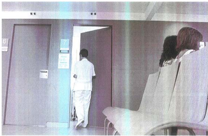
Los médicos de los ambulatorios atienden cada vez a más pacientes con problemas de salud mental

"Los factores que influyen en el bienestar