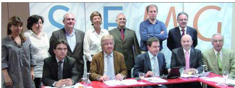
Los miembros del Foro de Médicos de Atención Primaria (que forman Semfyc, Sermergen, SEMG, AEPap, CESM y la OMC) se han reunido esta vez en la sede de SEMG para consensuar sus objetivos prioritarios y crear grupos de trabajo que agilicen su funcionamiento.

cialidad que se presenta como poco atractiva. Entre estas medidas, los profesionales del primer nivel han planteado una serie de