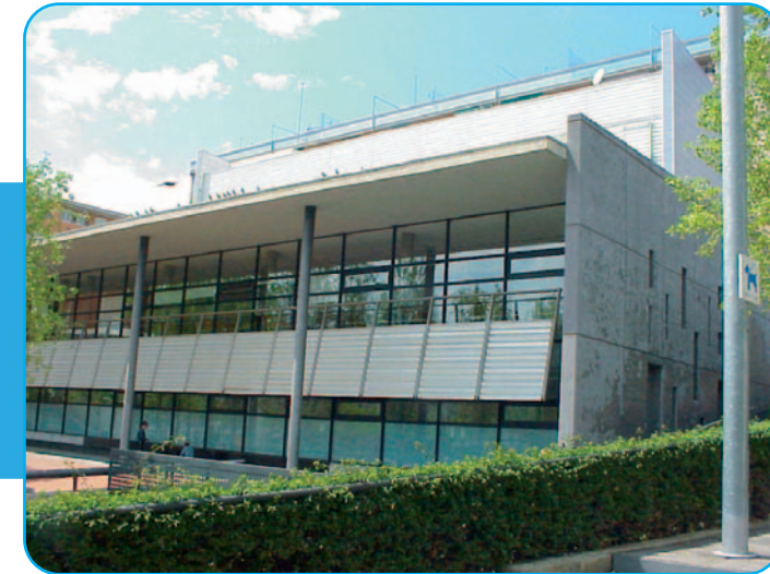
Centre de santé CAP Bòbila. Institut Català de la Salut. Esplugues (Barcelona)

Activité formative accréditée avec de 7,2 crédits