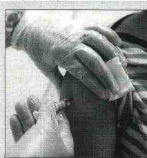
Vacunar-se contra la grip serà recomanable

És recomanable. A la tardor estaran circulant simultàniament els virus de les dues gripes. Tot i que la vacuna de la grip comuna no actua sobre la nova, és convenient reduir les possibilitats de contreure-la. Cal recordar que cada any s'actualitzen les vacunes per fer front a les mutacions.