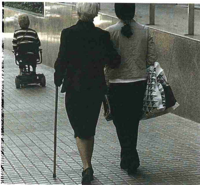
La prevenció és clau i caminar, una de les pràctiques més recomanades

La necessitat de tenir més professionals sanitaris també inclou millores de les retencions a metges, metgesses, infermers i infermeres; l'increment de les places de residents (MIR)