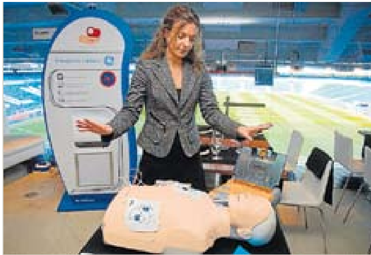
Un desfibrilador en el Bernabéu. ÁNGEL NAVARRETE